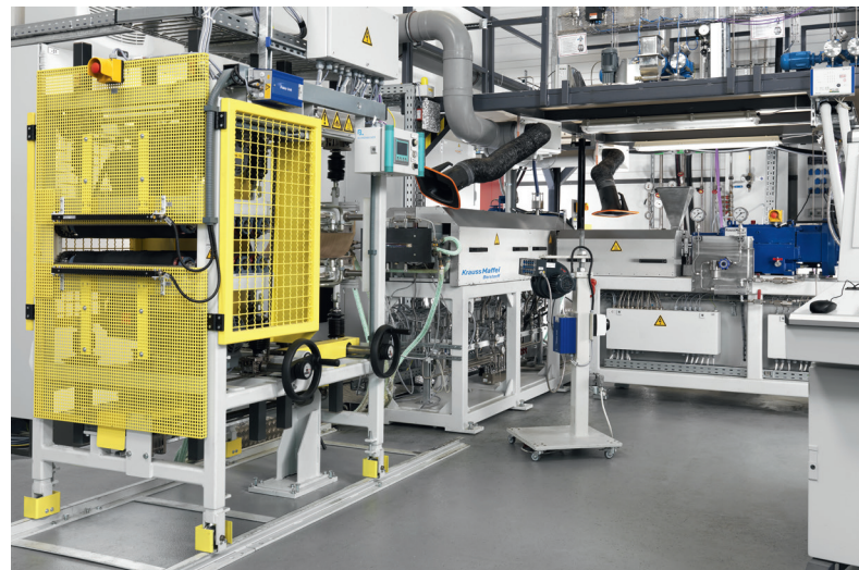
KraussMaffei Berstorff-Schaumtandex ZE30/KE60

Geschäumte Kunststoffe erfordern ein maßgeschneidertes Eigenschaftsprofil, um im komplexen Schäumprozess zu einem optimierten Ergebnis zu gelangen. Dazu bietet das Fraunhofer ICT das Know-how sowie zahlreiche Anlagentechnologien zur gezielten Entwicklung an. Mit flexibel anpassbaren Anlagenkonzepten (Extruder- und Schneckenkonfiguration) lassen sich Materialien und Prozesse weiterentwickeln, um somit zu dem gewünschten Ergebnis zu gelangen.